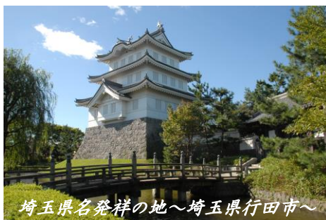
埼玉県名発祥の地～埼玉県行田市～