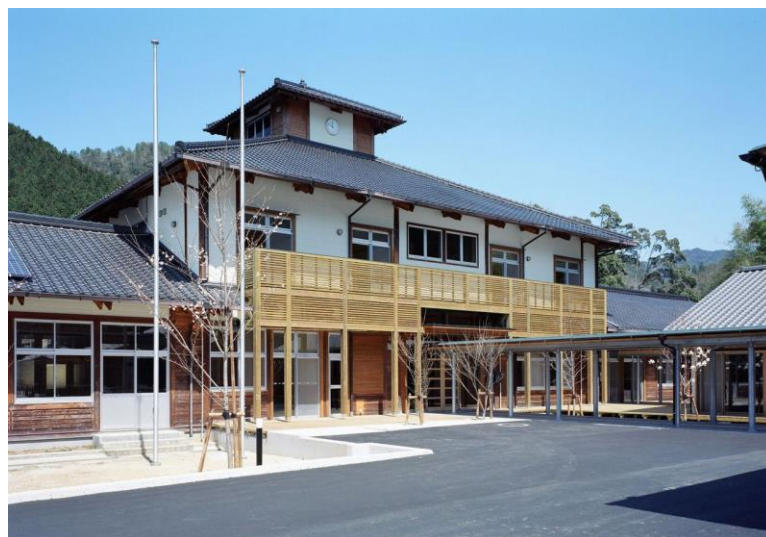
障害者交流センター