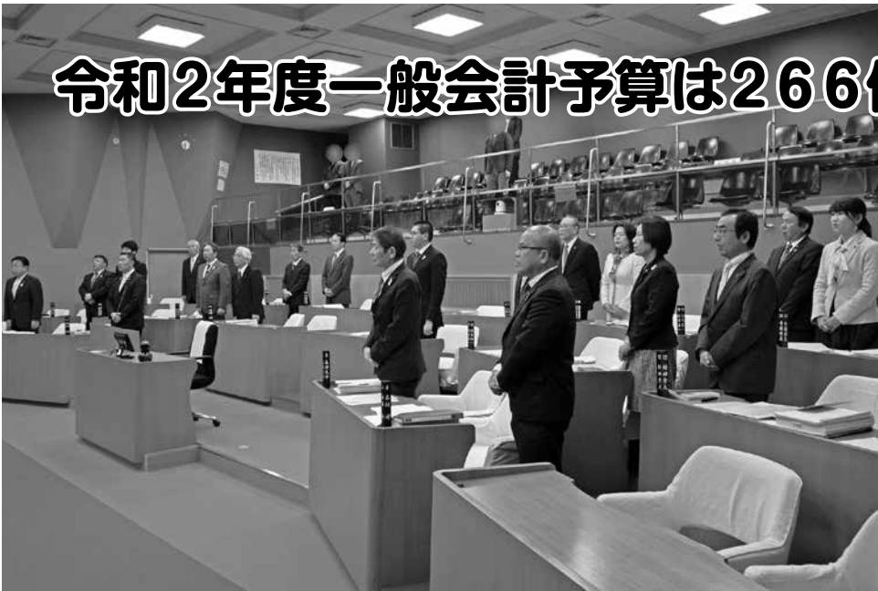
議場風景(3月定例会)

3月定例会には、市長提出議案34件が提出され、すべての案件を原案のとおり可決・同意しました。