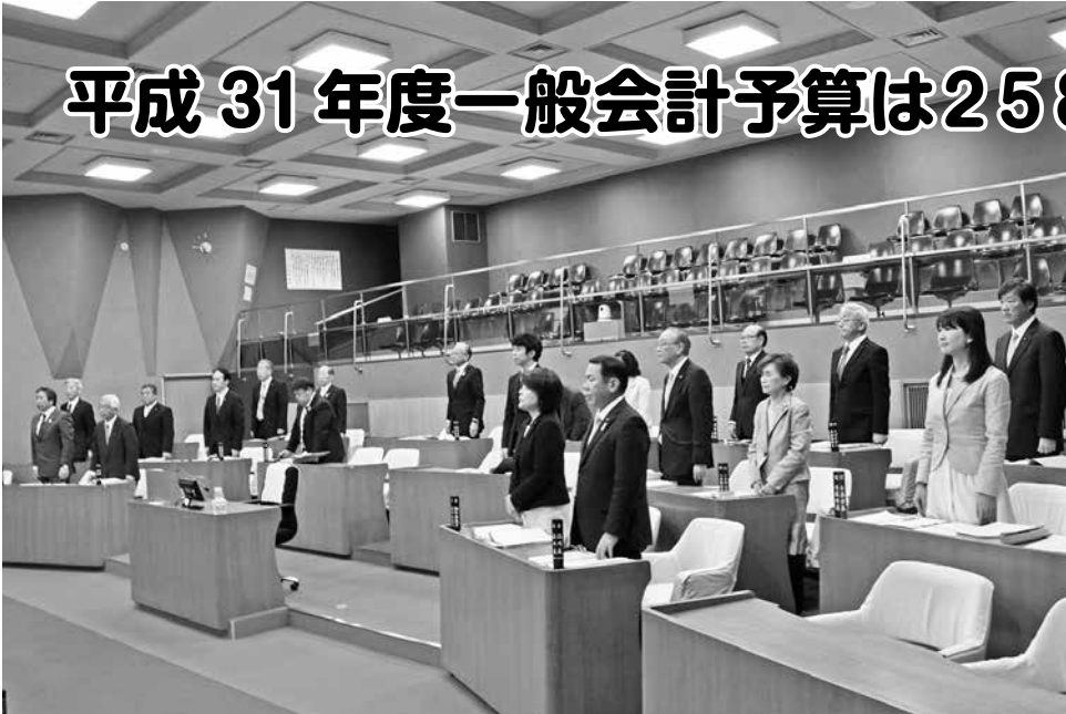
議場風景(3月定例会)

3月定例会には、市長提出議案21件が提出され、すべての案件を原案のとおり可決しました。