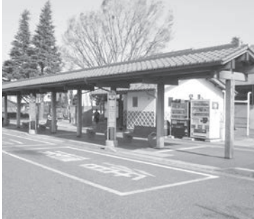
循環バスターミナル

設置場所は市内循環バスターミナルの一角を予定しており、平成26年度に設計、平成27年度に施工する計画である。施設の内容としては、観光案内所を兼ねた自転車の貸し出し場所のほかに、バスの待合所としても利用できるような整備していく。