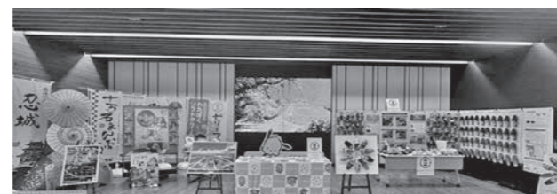
武蔵野銀行本店 M's SQUARE での展示の様子

▶場所 ソニックシティホール1階エントランス(さいたま市大宮区桜木町1-7-5)