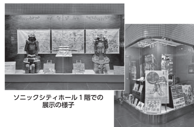
ソニックシティホール1階での展示の様子