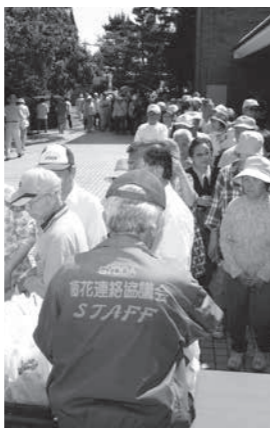
昨年の無料配布の様子