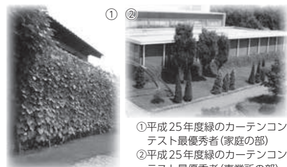
①平成25年度緑のカーテンコンテスト最優秀者(家庭の部) ②平成25年度緑のカーテンコンテスト最優秀者(事業所の部)