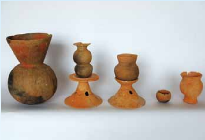
祭祀に使われた土器(武良内遺跡)

「市報ぎょうだ」6月号で、古墳時代前期(4〜5世紀前半)の市内の集落の移り変わりを紹介しましたが、そのころの堅穴住居を発掘すると、実用品とは思えない小型の土器がまとまって出土することがあります。それらの土器には、大型のかめやつぼを小さく模造したもの(写真右端)、小さな鉢やおわんをつくったもの(写真右から2番目)などがあります。まるで子どもが「ままごと」に使うようなミニチュア土器ですが、川沿いなどか