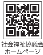
社会福祉協議会ホームページ