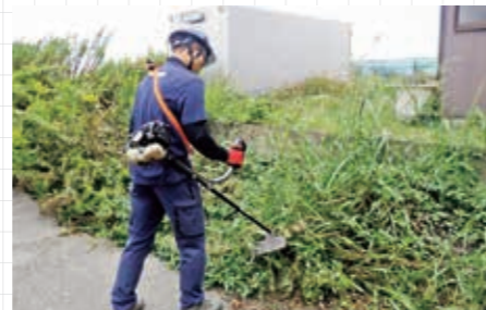
有償ボランティアによる除草作業助成事業

年々増加する除草要望に対応し、景観の保全や道路・水路などの機能確保を図るため、地域環境の保全に取り組むボランティアなどの除草活動を支援します。