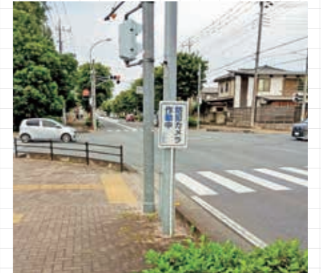
防犯カメラ設置事業

空き巣などの対策として、住宅に防犯カメラを設置する世帯に対して補助金を交付します。