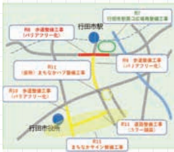
まちなかウォークブル推進事業