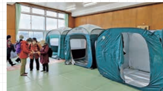
防災・減災の推進