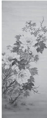
益田樸岳画「牡丹図」(郷土博物館蔵)