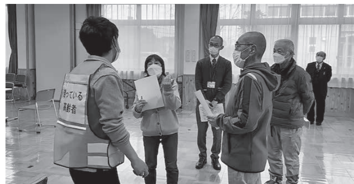
認知症役の人に声を掛けている様子