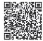
動画で見る確定申告 検索