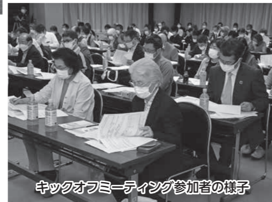
キックオフミーティング参加者の様子

5月16日、商工センターでプロジェクトの趣旨に賛同いただいた企業・団体の方々、キックオフミーティングを開催しました。