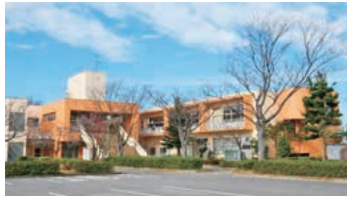
【創立】明治19年(1884) 【所在地】上池守47 【閉校時児童数】57人