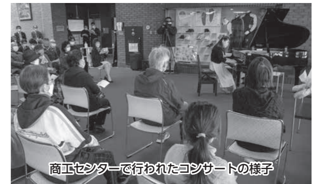
商工センターで行われたコンサートの様子

▶問い合わせ 商工センター ☎553-0510、 コミュニティセンターみずしろ ☎554-6797