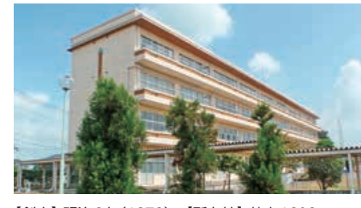
【創立】明治6年(1873) 【所在地】荒木1606 【閉校時児童数】105人