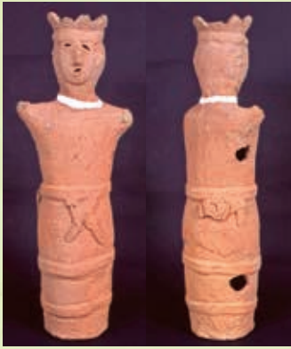
鎌と縄を持つ男子埴輪 (郷土博物館蔵)

大きな特徴は左腰に着けられたX型のパーツと、背面右腰に見られるL字型の粘土帯の上に重ねられたドーナツのような丸いパーツです。この腰のX型のパーツは形状から鎌、背面のパーツは丸められた縄を表現している可能性が指摘されています。