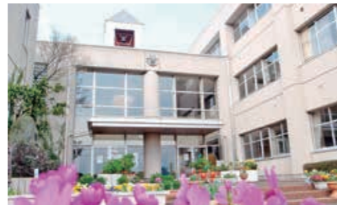
【創立】明治7年(1874) 【所在地】北河原1517 【閉校時児童数】19人