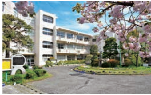
【創立】明治5年(1872) 【所在地】本丸7-20 【閉校時児童数】367人