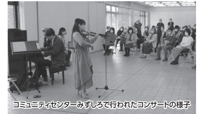
コミュニティセンターみずしろで行われたコンサートの様子

ストリートピアノの設置を記念して、オープニングコンサートが開催され、4月1日、商工センターで行田音楽家協会会員が「さくら さくら」や「トルコ行進曲」などを披露しました。また、2日には、コミュニティセンターみずしろで行田アンサンブル協会会員が「リベルタンゴ」「情熱大陸」などを披露しました。