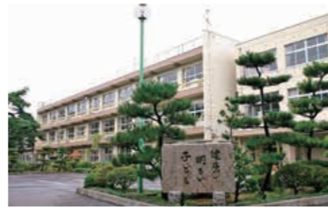
【創立】明治6年(1873) 【所在地】須加4586 【閉校時児童数】46人