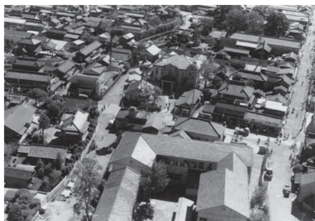
昭和30年代の町なみ(郷土博物館蔵)

郷土博物館では、小学3年生の学習に連動して博学連携展示「行田市のうつりかわり」を開催します。昭和初期からの市内の道路や鉄道、公共施設の移り変わりなどを中心に、生活の道具や関連する資料、昔の写真などを展示します。変わりゆく行田市の姿をご覧ください。