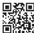
確定申告 🔍 検索