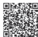
動画で見る確定申告 🔍 検索