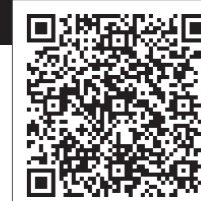
イベントなどの中止・延期情報

なお、「市報ぎょうだ」の掲載の有無に関わらず、一部イベントなどが中止・延期となる場合がありますので、事前に各問い合わせ先にご確認ください。中止・延期が決定したイベントなどは、市ホームページに随時掲載していますので、ご覧ください。