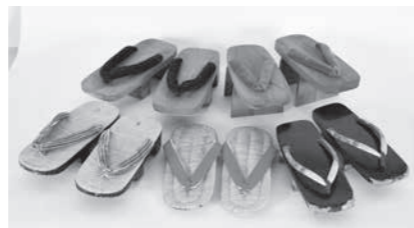
近現代の下駄と草履 (郷土博物館所蔵)