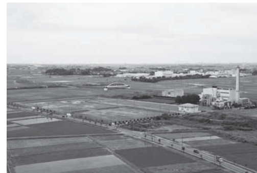
新ごみ処理施設建設予定地 (小針グリーンセンター隣接地)

昨年7月から羽生市とごみ処理広域化に向けた勉強会を実施し、意見交換を重ねてきましたが、このたび、本市の新ごみ処理施設整備方針として、羽生市との広域化を進めることを決定しました。3月16日(火)、基本合意を締結し、新施設整備に向け正式に事業をスタートする予定です。