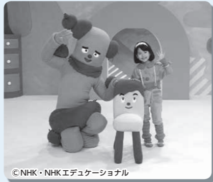
サボさん、コッシー、スイちゃん