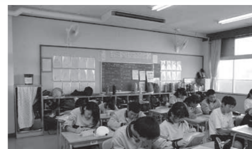
快適な学習環境の中で勉強に励む生徒たち

昨年度は、普通教室279室にエアコンを283台設置し、今年の夏から稼働しています。また、今年度は、理科室や家庭科室などの特別教室に設置する予定です。先生からは、「エアコンが設置されたことで、児童・生徒たちは喜んでます。暑い中での授業に比べると、集中して授業を受けています。そして、聞く姿勢もよくなりました」と、児童・生徒たちの様子を述べていました。