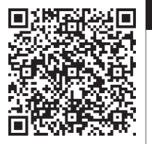
イベントなどの中止・延期情報

なお、「市報ぎょうだ」の掲載の有無に関わらず、一部イベントなどが中止・延期となる場合がありますので、事前に各問い合わせ先にご確認ください。中止・延期が決定したイベントなどは、市ホームページに随時掲載していますので、ご覧ください。