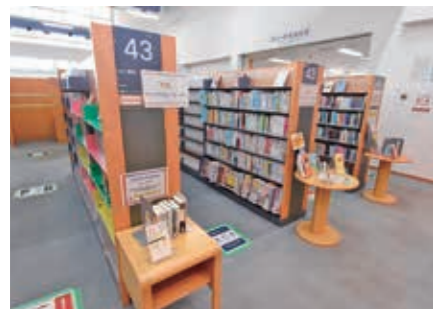
YA(ヤングアダルト)コーナー

秋 は、読書に一番適した季節であることに由来する「読書の秋」です。しかし、インターネットなどの情報メディアの発達・普及により、「読書離れ」「活字離れ」が指摘されています。そのような中、図書館では、より多くの方が本に親しみを持ってもらえるよう館内を大人向け、中学・高校生向け、子ども向けに分け、利用者やテーマに沿った本を展示するコーナーを設置しています。各コーナーでは、約30万冊の蔵書の中から職員が選んだ本を月替わりで紹介しています。読書をする以外にも、調べものをし、新たな知識を得る学習の場としての利用