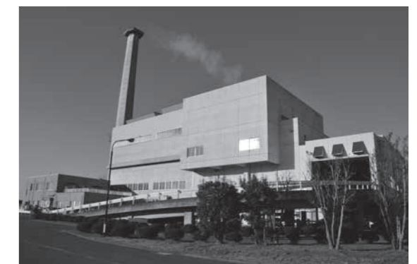
小針クリーンセンター