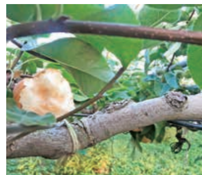
アライグマによって食べられたスイカ(左)と梨(右)