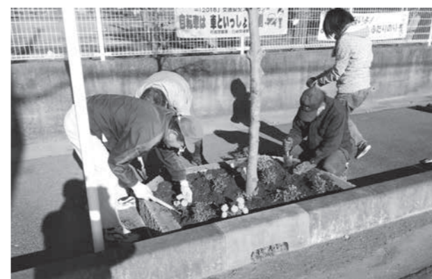
里親の皆さんによる太田東小学校前の花壇の手入れの様子