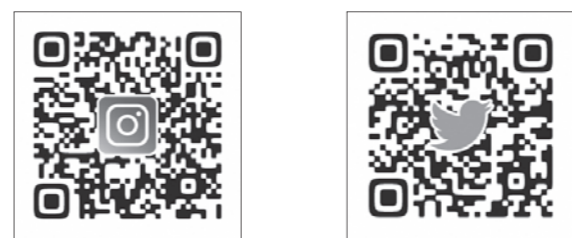
【古代蓮の里 公式Instagram】 【古代蓮の里 公式Twitter】

古代蓮の里では、公式ツイッターおよび公式インスタグラムを開設しており、季節ごとの園の様子や、各種イベント情報などを発信しています。また、蓮の開花期には開花状況なども日々更新していきますので、ぜひフォローしてください。なお、公式ツイッターおよび公式インスタグラムの内容は、古代蓮の里公式ホームページからもご覧いただくことができます。