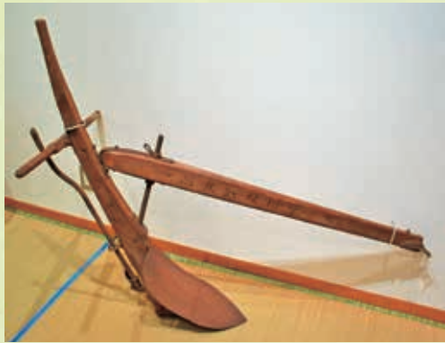
オンガ (行田市郷土博物館蔵)

たんなる土地に適した操作性を持つ近代短床犁で、西日本製の近代農具から行田の土地に適したものを選んで使用していたことがうかがえます。 本資料は、郷土博物館で開催中の博学連携展示「むかしのくらし」にて、4月5日まで展示されています。 (郷土博物館 岡本夏美)