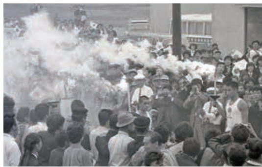
東京1964オリンピック聖火リレーの様子

東京2020大会では、ギリシャ・オリンピアの太陽光で採火された聖火が3月26日に福島県を出発し、全国47都道府県を巡ります。県内では7月7日～9日の3日間行われ、このうち行田市は8日に受け継がれ、大長寺前(行田)から郷土博物館前までの県道128号の区間を走る予定です。