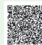
【応募フォームリンク用二次元バーコード】