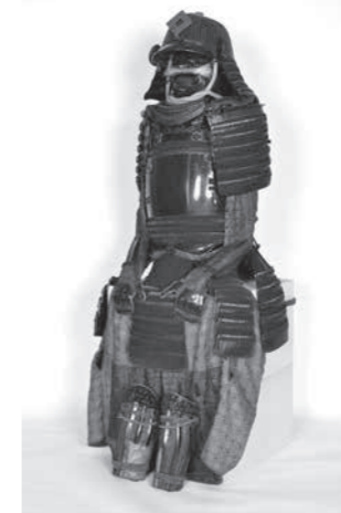
忍藩主松平家臣 服部家伝来 鉄黒漆 塗胸取縦列桶側二枚胴具足