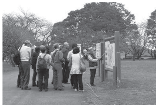
さきたま古墳公園でガイドを行う観光ボランティア会員