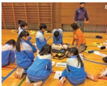
「救命入門コース」に真剣に取り組む生徒たち

応急手当を行ったりAEDを使ったりすることは決して難しいことではありません。正しい知識を身に付けることで誰でもできることです。大切な人の命を救うために、まずは講習に参加し、その一歩を踏み出してみませんか。