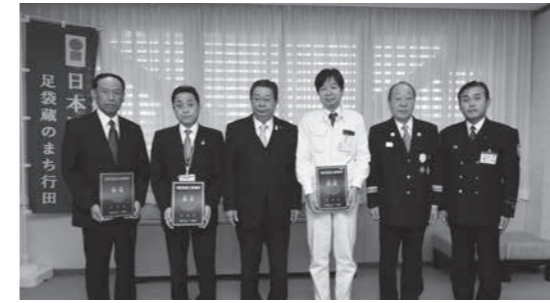
工藤市長から「消防団協力事業所表示証」を 交付された各事業所代表者

行田市消防団協力事業所表示制度では、消防団員を従業員として雇用するなど、消防活動に対し積極的に協力している事業所や団体などに「消防団協力事業所表示証」を交付し、地域防災体制のより一層の充実を図っています。