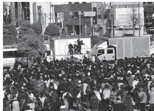
ドラマ「陸王」のロケの様子