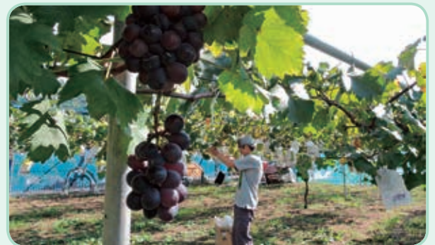
地域の方とともに栽培するぶどう