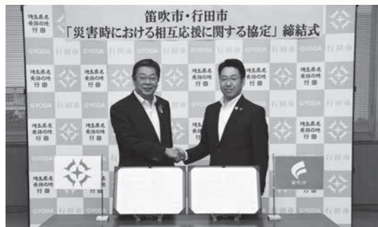
協定を締結した工藤市長と山下政樹笛吹市長(右)

10月13日、山梨県笛吹市と「災害時における相互応援に関する協定」を締結しました。この協定は、本市または笛吹市で災害が発生した場合に、資機材・物資の提供、被災者の一時受け入れなどについて相互に応援協力することを目的としたものです。