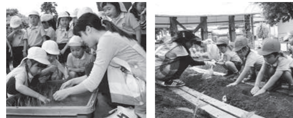
田植えを行う年長組の皆さん