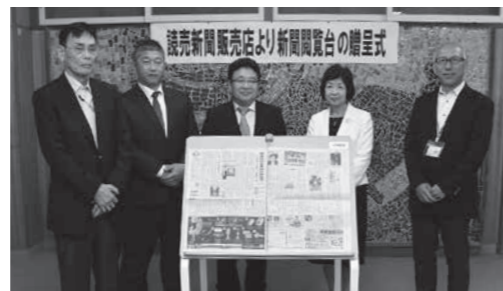
読売新聞販売店3店から寄贈された新聞閲覧台