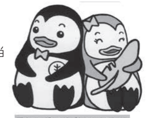
更生ペンギンのほごちゃんさうちゃん