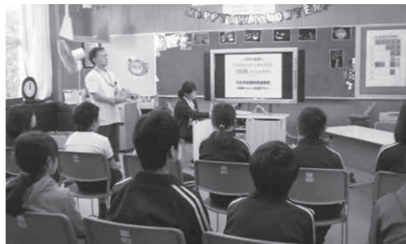
医師による喫煙防止講演の様子