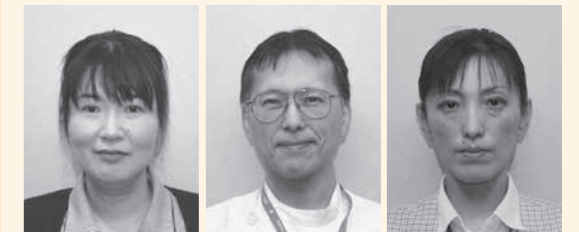
行田市認知症初期集中支援チームの皆さん

高齢者の約4人に1人が認知症またはその予備軍といわれています。認知症になっても、本市でいつまでも住み続けられるようにするため、認知症の初期段階で、早期発見・早期治療を行えるように支援する専門職チーム「行田市認知症初期集中支援チーム」が発足しました。