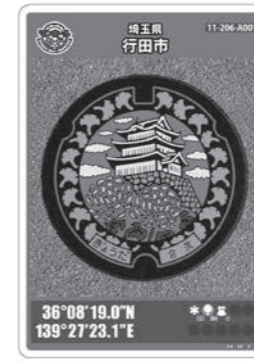
マンホールカード

全国で100種類以上が配布され、人気を集めているマンホールカードを本市でも配布します。ぜひ集めてみませんか。