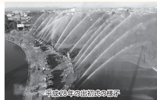
平成28年の出初式の様子

安心・安全な行田を担う消防職団員が一堂に会し、市民の皆さんと共に一年の安全を願い、防火防災思想の普及と消防職団員の結束を図ることを目的として行田市消防出初式を実施します。