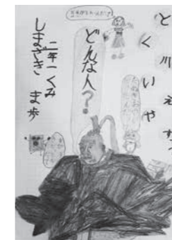
島崎真歩さんの作品