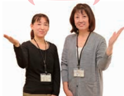
サポセン職員が皆さんの活動をサポートします

サポセンでは、市民公益活動に関わるさまざまな相談に応じています。※開所時間は月・火・木・土曜日（コミュニティセンターみずしろの休館日を除く）午前9時～午後5時 ▼問い合わせ 地域づくり支援課 協働推進担当（内線253）、市民活動サポートセンター ☎598-8616