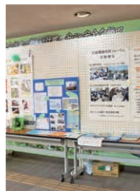
11月12-13日に開催された「みずしろフェス」での活動発表の様子

つまり、市民公益活動は、皆さんが人生をより楽しむための「味付け」であるとも言えることができます。あなたもぜひ、市民公益活動を始めて、今より「ちょっとだけ」人生を豊かにしてみませんか。