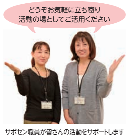
サポセン職員が皆さんの活動をサポートします

サポセンでは、市民公益活動に関わるさまざまな相談に応じています。※開所時間は月・火・木・土曜日（コミュニティセンターみずしろの休館日を除く）午前9時～午後5時 ▼問い合わせ 地域づくり支援課 協働推進担当（内線253）、市民活動サポートセンター ☎598-8616