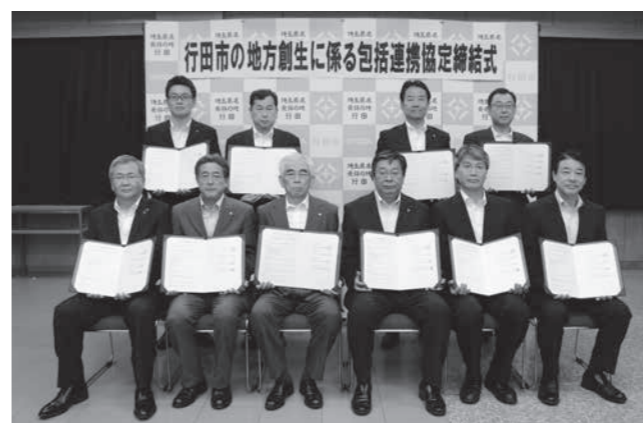
協定書を手にする工藤市長と協定先代表の皆さん