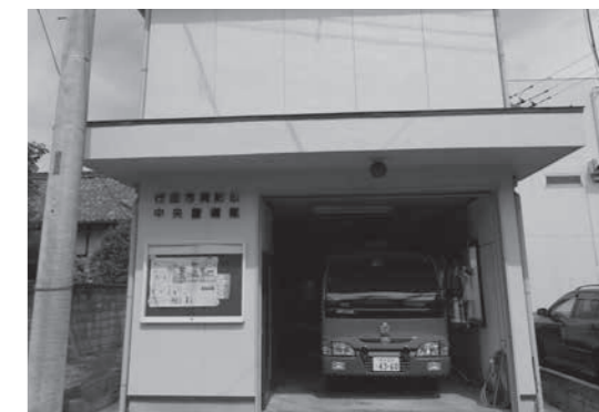
中央警備隊庁舎 (旧団本部第2警備隊庁舎)