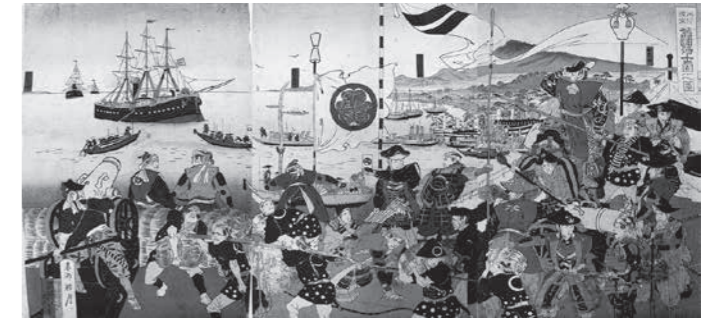
米船渡来旧諸藩土御固之図(当館所蔵)

18世紀半ば以降、異国船が日本列島の近海に頻りに現れるようになり、忍藩は幕府から江戸湾沿岸警備の一翼を担うよう命じられました。本展覧会では、忍藩の動向をめぐる資料を中心に展示することで、沿岸警備の実態と人々の活動を紹介します。