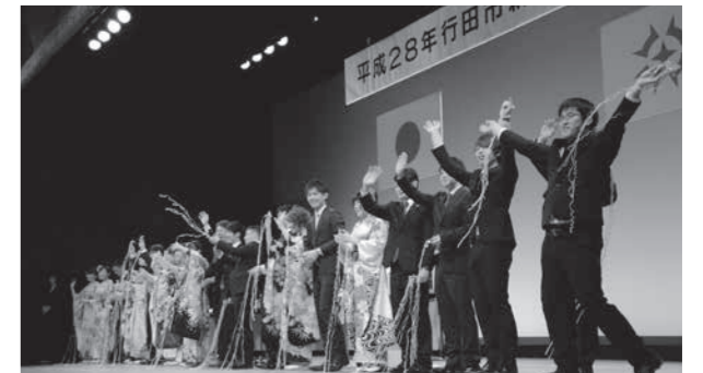
平成28年行田市新成人を祝う会の様子