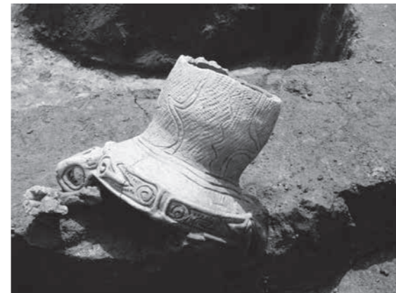
ほぼ完全な形で発掘された縄文式土器(約5,000年前)