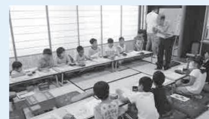
昨年の夏休み伝統文化体験教室の様子