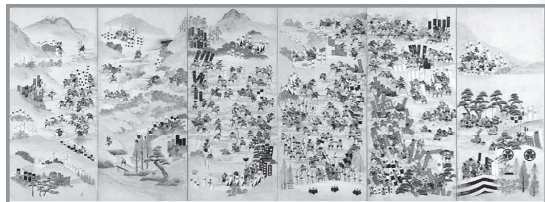
せきがはらかつせんぎょうぶが させき 関ヶ原合戦図屏風 左隻(同館蔵)