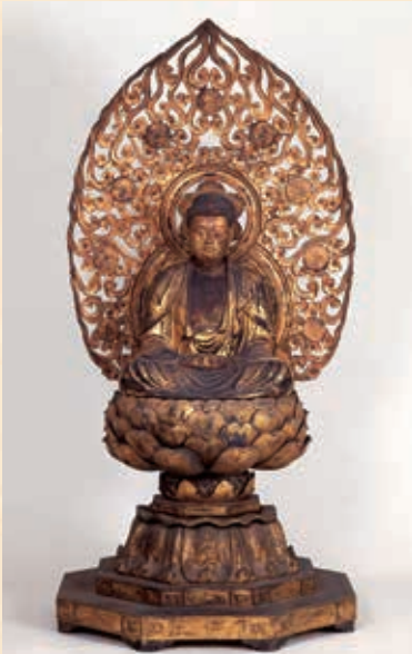
木造阿弥陀如来坐像

本像の特徴の一つは、底面に製作年代や作らせた人物を記した墨書があることです。「武州騎西郡糯田郷六角堂 阿弥陀像一軀 大檀那沙門唯信 正慶元年 壬申正月十一日造始 同癸酉十月下旬奉修造也」と書かれており、鎌倉時代末期である正慶元年（1332）に作り始め、翌年に出来たことが分かります。元々は糯田郷の六角堂の阿弥陀如来であり、糯田郷は持田村のことと思われるが、六角堂は現存していません。しかし、持田につながる「糯田」という地名がすでに鎌倉時代には使われていたことがこの墨