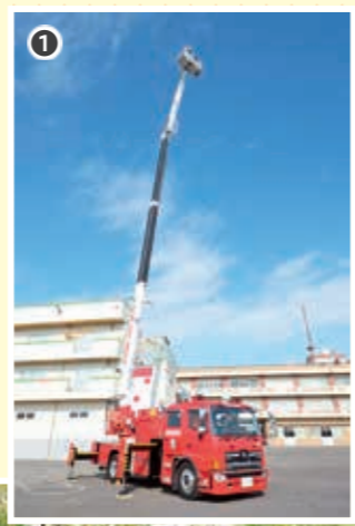
①屈折はしご付き消防自動車を更新 ②園児に防火教育を行う 浮き城消防隊住警器マン