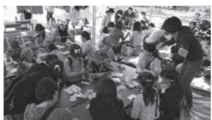
昨年の子どもまつりの様子