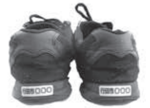
10月1日から配布する徘徊高齢者等発見シール

市では、認知症により著しい徘徊行動が見られる高齢者などが所在不明になった場合に、その方の早期発見と事故の未然防止を図るとともに、家族の精神的負担の軽減を図るため、「徘徊高齢者等早期発見シール」の配布を開始します。