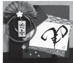
アート書道 作品例