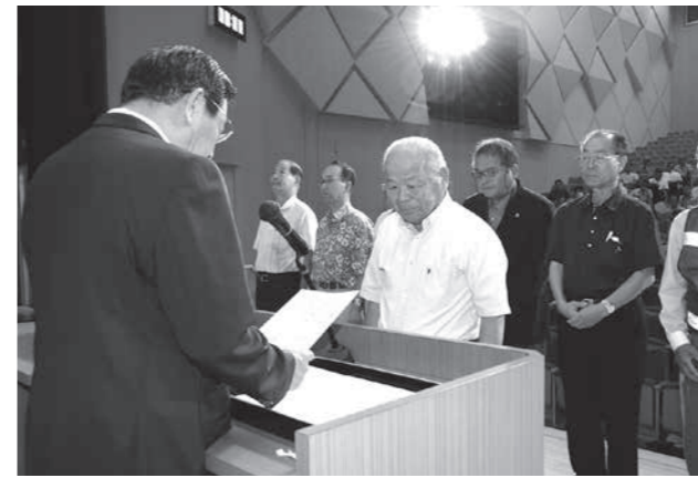
市長から委嘱を受ける委員の皆さん