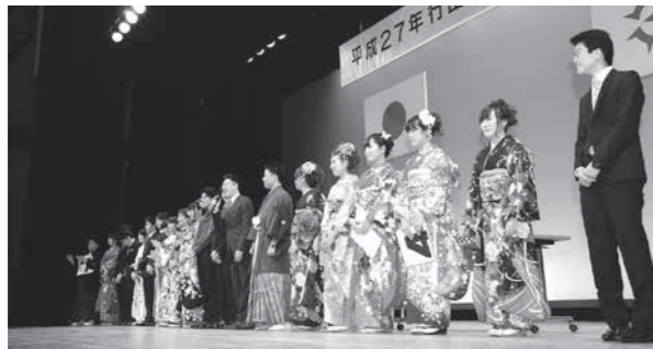
今年の新成人を祝う会の様子