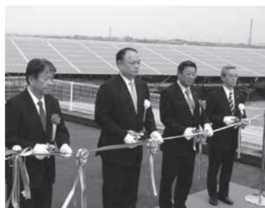
竣工式でのテープカットの様子