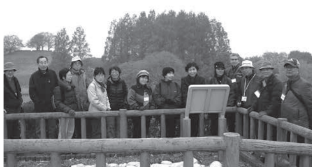
さきたま古墳公園で観光案内を行う行田観光ボランティア会員

▶申し込み・問い合わせ 観光案内所 ☎550-1611 または行田市観光協会(商工観光課内・内線382)