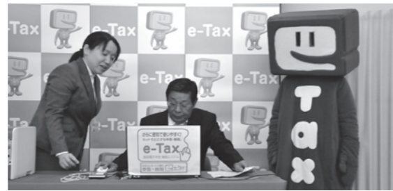
e-Taxで確定申告を行う工藤市長

なお、e-Taxで申告を行うと、添付書類の省略や還付金を早く受け取れるなどのメリットがあります。市民の皆さん、確定申告の際はぜひe-Taxをご利用ください。