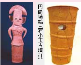
女子人物埴輪(酒巻14号墳)

円筒埴輪は、古墳の墳裾部や墳丘上、中堤上、周溝の外側などに、古墳を取り囲むように列状に並べて立てられることが一般的で、聖域を区画するために立てられたと推測されています。要所につきばを上に乗せた姿を表現した朝顔形円筒埴輪が立てられることもあります。大型の古墳には大型で背丈の高い円筒埴輪が、小型の古墳には小型で背丈の低い円筒埴輪が立てられています。