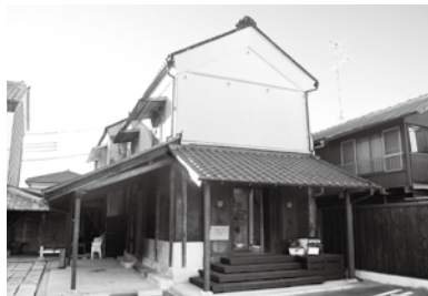
ライ 足袋蔵パン工房rye (行田・新町アーケード)

平成25年度は、この制度を利用して新たに8店舗が営業を開始しました。なお、制度が始まった平成19年度からの累計では52店舗が出店し、そのうち48店舗が現在まで継続して事業を行っています。