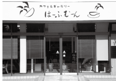
カフェ&ギャラリーはーふむーん (佐間・南小学校前)