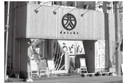
うどん大地 (忍・市役所前)