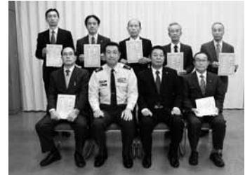
自衛官募集相談員に委嘱された皆さん

自衛隊埼玉地方協力本部熊谷地域事務所 ☎522-4855 または 総務課総務法規担当(内線216)