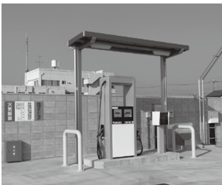
完成した災害対応型危険物自家給油取扱所