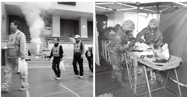
外に避難する参加者

いつ発生するか分からないテロなどに対処するためには、日ごろからの訓練が必要です。本番さながらの訓練に参加者は真剣に取り組んでいました。