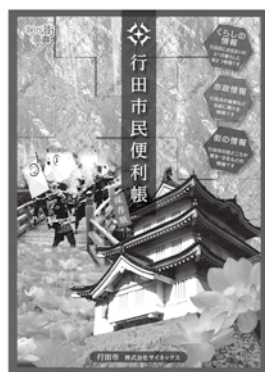
平成22年度に発行した行田市民便利帳