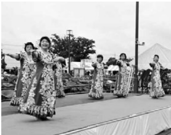
昨年の蓮まつりの様子